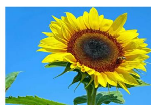
Couleur